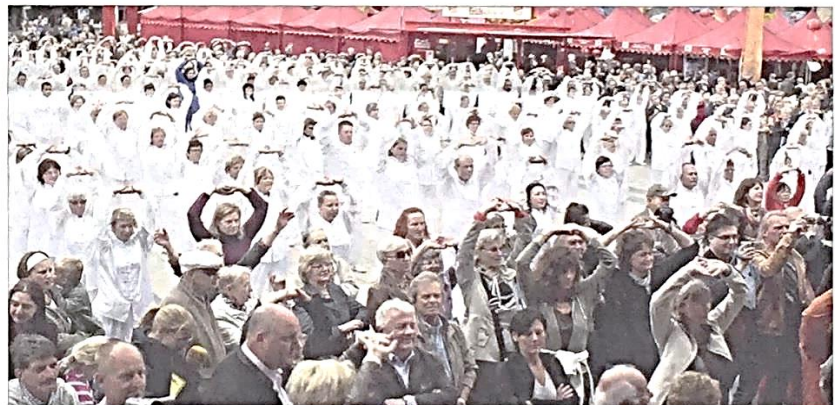
Tai Chi zum Mitmachen: Auf dem Roncalliplatz zeigte die DJK Wiking ihr Können, und viele Besucher versuchten sich gleich mit in der chinesischen Kampfkunst.

Neben den Gästen auf der Bühne waren auf dem Roncalliplatz an diesem Wochenende unzählige Stände versammelt: deutsch-chinesische Partnerschaftsvereine, aber auch chinesische Mediziner, Schneider, Künstler und Teeverkäufer. Am Stand der Gesellschaft für Deutsch-Chinesische Freundschaft Düsseldorf konnte man das Brettspiel Mah-Jongg spielen oder sich seinen Namen in chinesischen Zeichen schreiben lassen. Am Rundschau-Stand wurde das