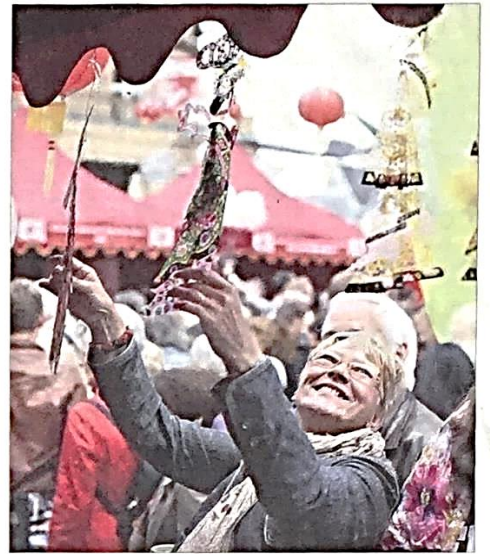
Feines aus Fernost: Viel Andrang an bei den chinesischen Ausstellern.