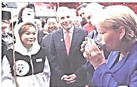
NRW-Ministerpräsidentin Hannelore Kraft darf als Schirmherrin bei der traditionellen Teeceremonie als erste nippen.